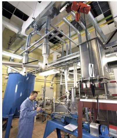
Usine-pilote de la compagnie Radiant Technologie

La technologie MAP est un ensemble de technologies de plate-forme innovatrices et écologiquement rationnelles qui favorisent le développement durable dans la bioéconomie. Comparativement aux méthodes traditionnelles d'extraction de produits, la technologie MAP offre des coûts de production plus